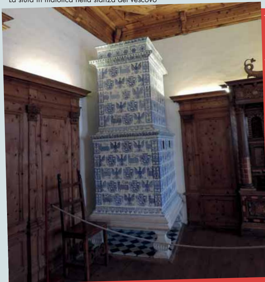
La stufa in maiolica nella stanza del vescovo

fermeremo l'opportunità di far emergere e di condividere riflessioni, iniziative, proposte didattiche concrete che possano rendere tangibile e quotidiano, nonché creativo, l'esercizio di Cittadinanza.